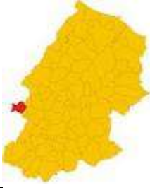
Durlia (popolazione residente al 1.01.2021 abitanti 398)-