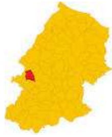
Fossalto (popolazione residente al 1.01.2021 abitanti 1.208)-,