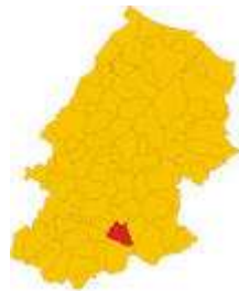
Gildone (popolazione residente al 1.01.2021 abitanti 759)-