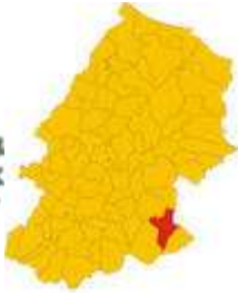
Gambatesa (popolazione residente al 1.01.2021 abitanti 1308)-,