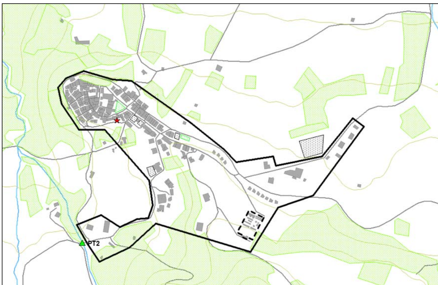
Immagine 1 – Provvidenti: con linea nera il Nucleo Urbano, con retino verde / marrone la copertura alberata-boscata rilevata da foto aerea.

All'interno del territorio di Provvidenti è stato individuato un nucleo urbano, presso il Concentrico (evidenziato con linea nera continua nell'immagine seguente).