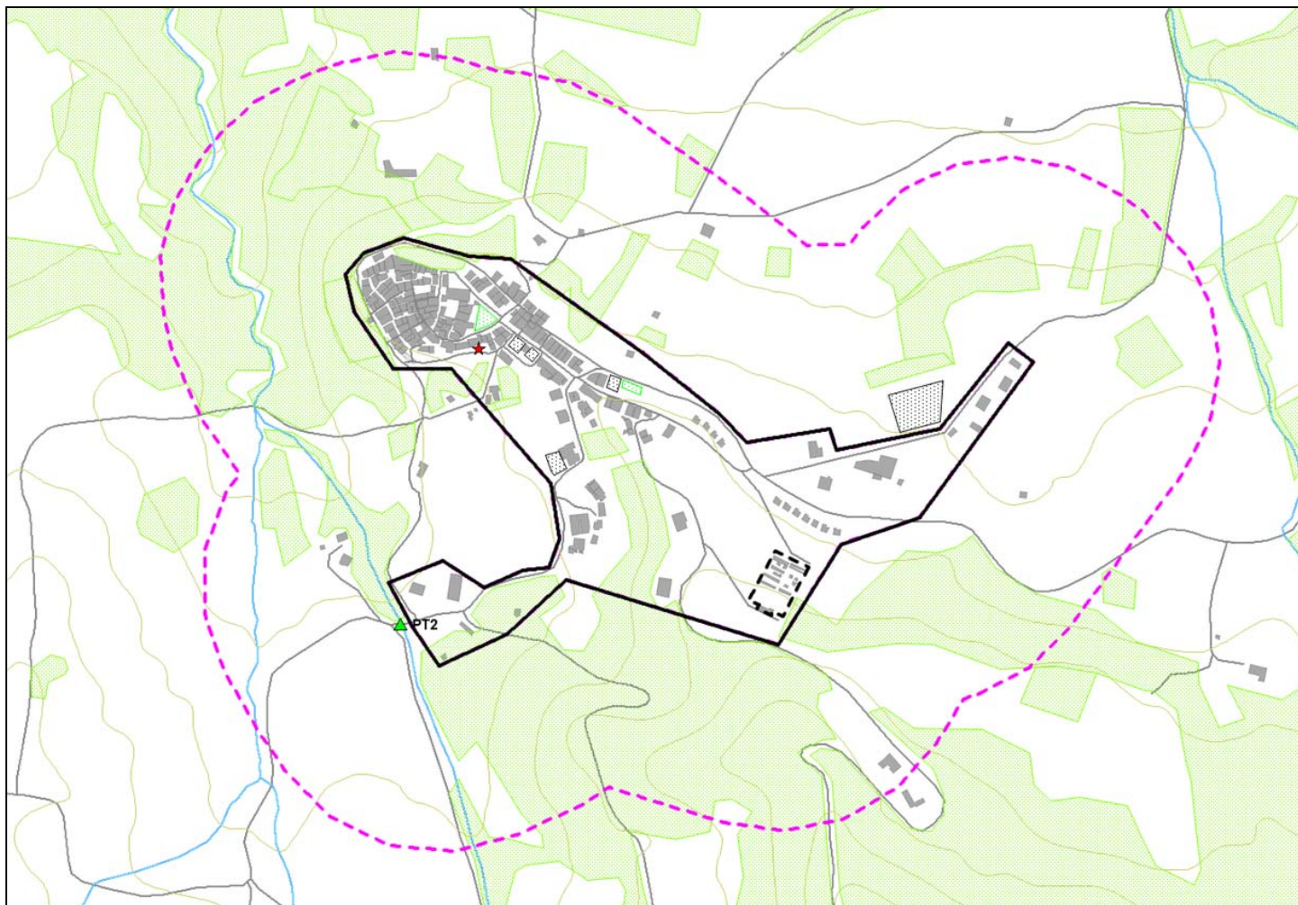
Immagine 2 – Provvidenti: con linea nera il Nucleo Urbano, con linea viola tratteggiata la Fascia perimetrale di 200 metri, con retino verde / marrone la copertura alberata-boscata rilevata da foto aerea.

Per i Nuclei Urbani del punto precedente è stata individuata una fascia perimetrale di 200 metri – linea tratteggiata di colore viola (eseguito buffer di 200 metri verso l'esterno).